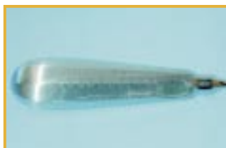
Zardzewiałe narzędzia Przyczyna: wysychanie wody