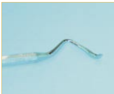
Narzędzie wytrawione resztkami żeluz