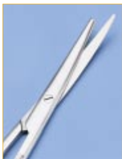
Nożyczki ze złamanym ostrzem. Przyczyna: nieumiejętna manipulacja (narzędzie zostało upuszczone)

Narzędzia muszą być ułożone ostrożnie na odpowiedniej tacy lub w pojemniku na narzędzia i jak najszybciej zdezynfekowane i umyte. Nieumiejętne obchodzenie się z narzędziami może je uszkodzić. Dzieje się tak z narzędziami o cienkich i delikatnych końcówkach, takimi jak szczypczyki, kleszcze, narzędzia do pobierania próbek, nożyczki, a szczególnie z tymi, które posiadają wstawki z węglików spiekanych (uchwyty do igieł, narzędzia do leczenia paradontozy).