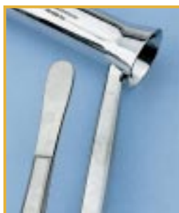
Plamy wodne na narzędziu

Plamy wodne powstają wtedy, gdy woda zawierająca sole rozpuszczone / minerały wysycha na narzędziach. Nieregularne plamy w wyraźnie zaznaczonymi brzegami powstają na nowych narzędziach.