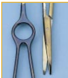
Tęczowe kolory – kolorowe błyszczące pokrycie krzemianowe