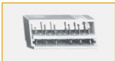
Stojak na wiertła

Dentystryczne narzędzia obrotowe i oscylacyjne ( kulki, narzędzia stalowe, diamentowe, z węglików spekanych, i polerujące) oraz narzędzia do kanału korzeniowego mogą być sterylizowane w urządzeniach pod warunkiem, że zostaną umieszczone na specjalnych stojakach (półkach). Narzędzia z węglików spekanych mogą korodować podczas sterylizacji i stracić ostrość.