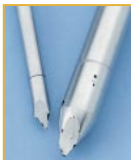
Korozja wżerowa trokaru Przyczyna: duża zawartość chlorku w wodzie