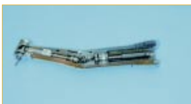
Budowa wewn. narzędzi ręcznych i kątowych