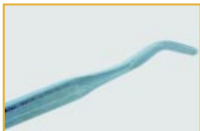
Szpatułka do wypełniania pokryta korozją Przyczyna: materiał zaatakowany przez kwasowy środek do usuwania cementu

Mogą ulec uszkodzeniu w kąpeli ultradźwiękowej.