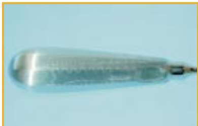
Zardzewiałe narzędzia. Przyczyna: wysychanie wody z dużą zawartością soli

Woda pitna może nie nadawać się do sterylizacji narzędzi