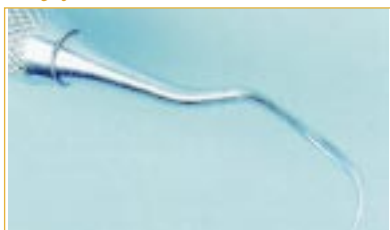
Tępy kiret okołozębowy

Złożona budowa wewnętrzna narzędzi ręcznych i kątowych oraz turbin wymaga specjalnego traktowania zgodnie ze wskazówkami producenta.