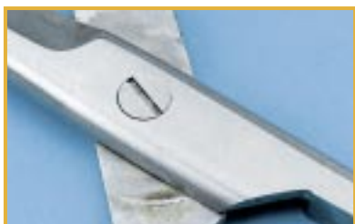
Korozyja nożyczek. Przyczyna: brak naoliwienia

Przeczytaj wskazówki producenta na temat sterylizacji kamer wewnątrzustnych.