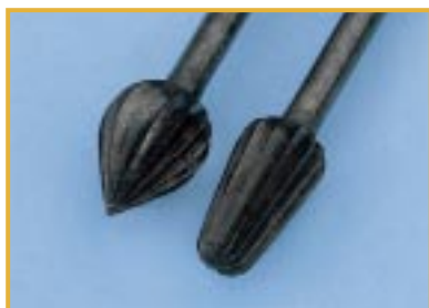
Koroźnia świdrów Przyczyna: Sterylizacja narzędzi jednorazowych

Nie wolno sterylizować narzędzi stworzonych do jednorazowego użytku. Muszą być one traktowane jako specjalne odpady i wykorzystane zgodnie z odpowiednimi przepisami.