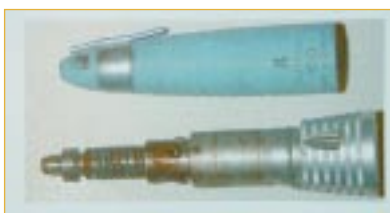
Resztki krwi na uchwycie Przyczyna: niedostatecznie wyczyszczenie