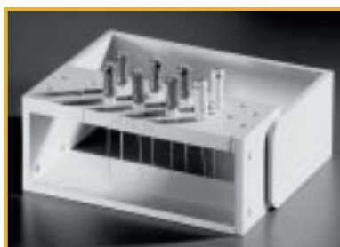
Stojak na narzędzia do kanału korzeniowego

Nie wolno sterylizować narzędzi stworzonych do jednorazowego użytku. Muszą być one traktowane jako specjalne odpady i wykorzystane zgodnie z odpowiednimi przepisami.