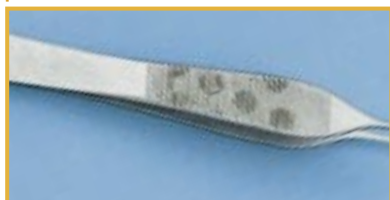
Plamki na szczypczykach

Przyczyna: Niedostateczna jakość pary wodnej