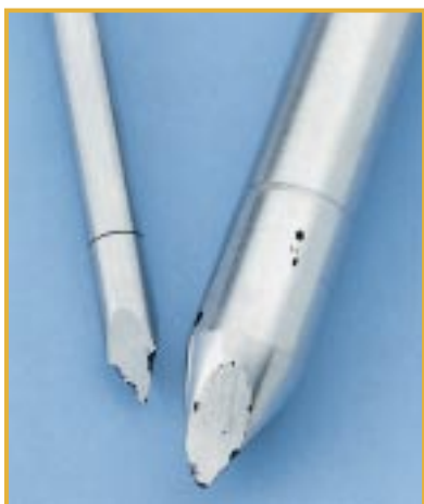
Korozja wżerowa trokaru Przyczyna: duża zawartość chlorku w wodzie

Duża zawartość chlorków powoduje korozję wżerową narzędzi