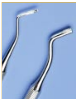
Narzędzia do wypełniania z przylegającymi kompozytami. Przyczyna: brak natychmiastowego mycia i sterylizacji

Czyszczenie ultradźwiękowe jest zalecane dla narzędzi z przylegającymi resztkami wypełniaczy, w tym celu należy sprawdzić, czy narzędzie nadaje się do kąpieli ultradźwiękowej (szczegółowe informacje znajdują się w rozdziale 4.1.1. pt. Ultradźwięki).