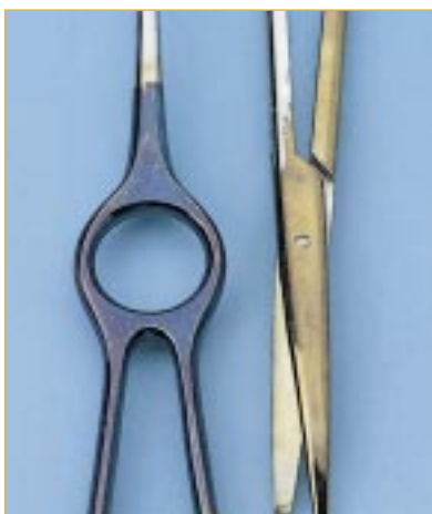
Przebarwienie narzędzi Przyczyna: niedostateczne wypłukanie